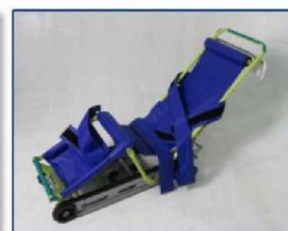
▲キャリダン(非常用階段避難車)