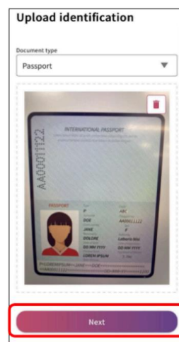
パスポートの情報をアップロード