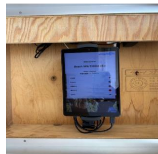
チェックイン用の タブレット