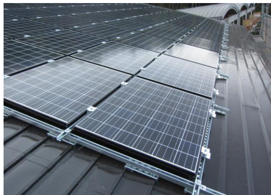
太陽電池モジュール